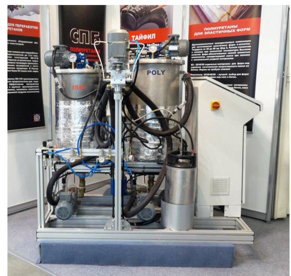
Заливочная машина CR-47/A

Производство изделий из полиуретана – многостадийный и достаточно сложный процесс, который начинается с кор-